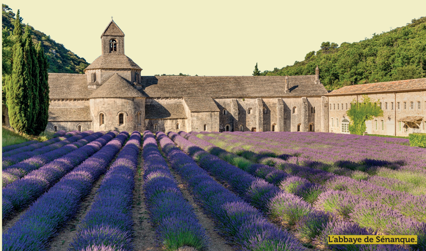
L'abbaye de Sénanque.