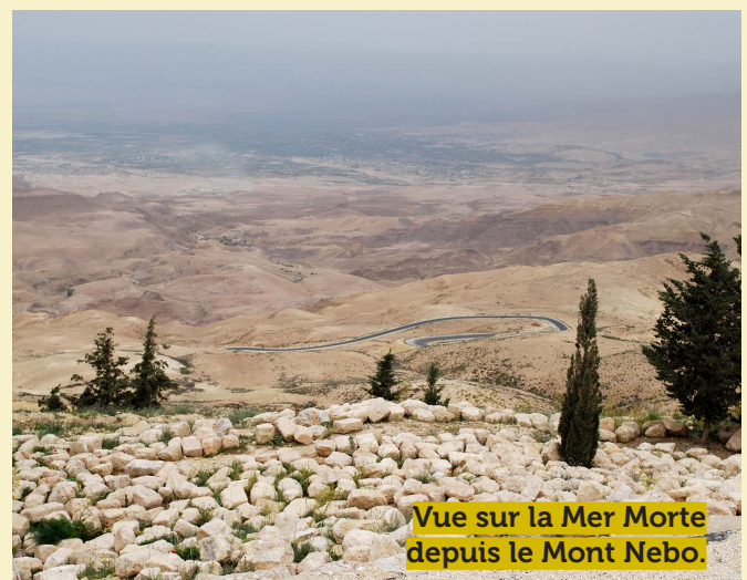
Vue sur la Mer Morte depuis le Mont Nebo.