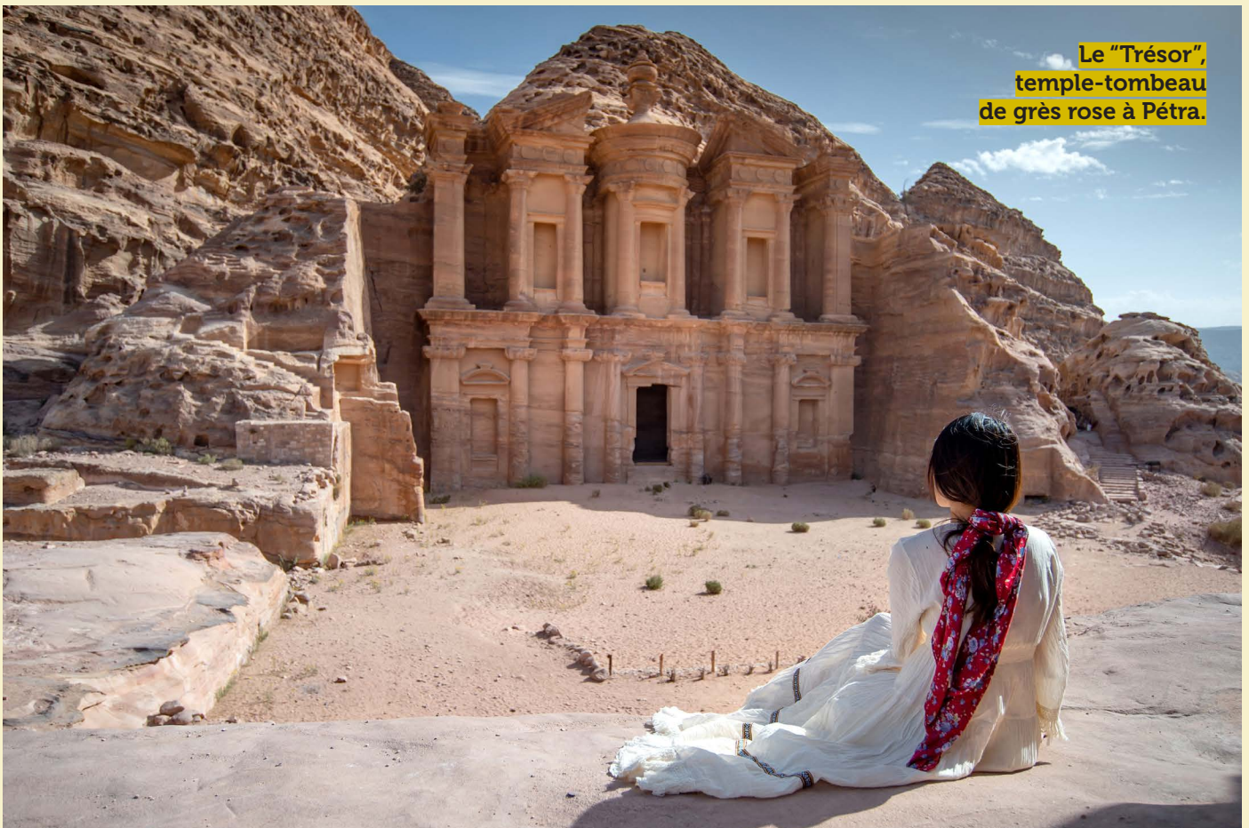
Le "Trésor", temple-tombeau de grès rose à Pétra.