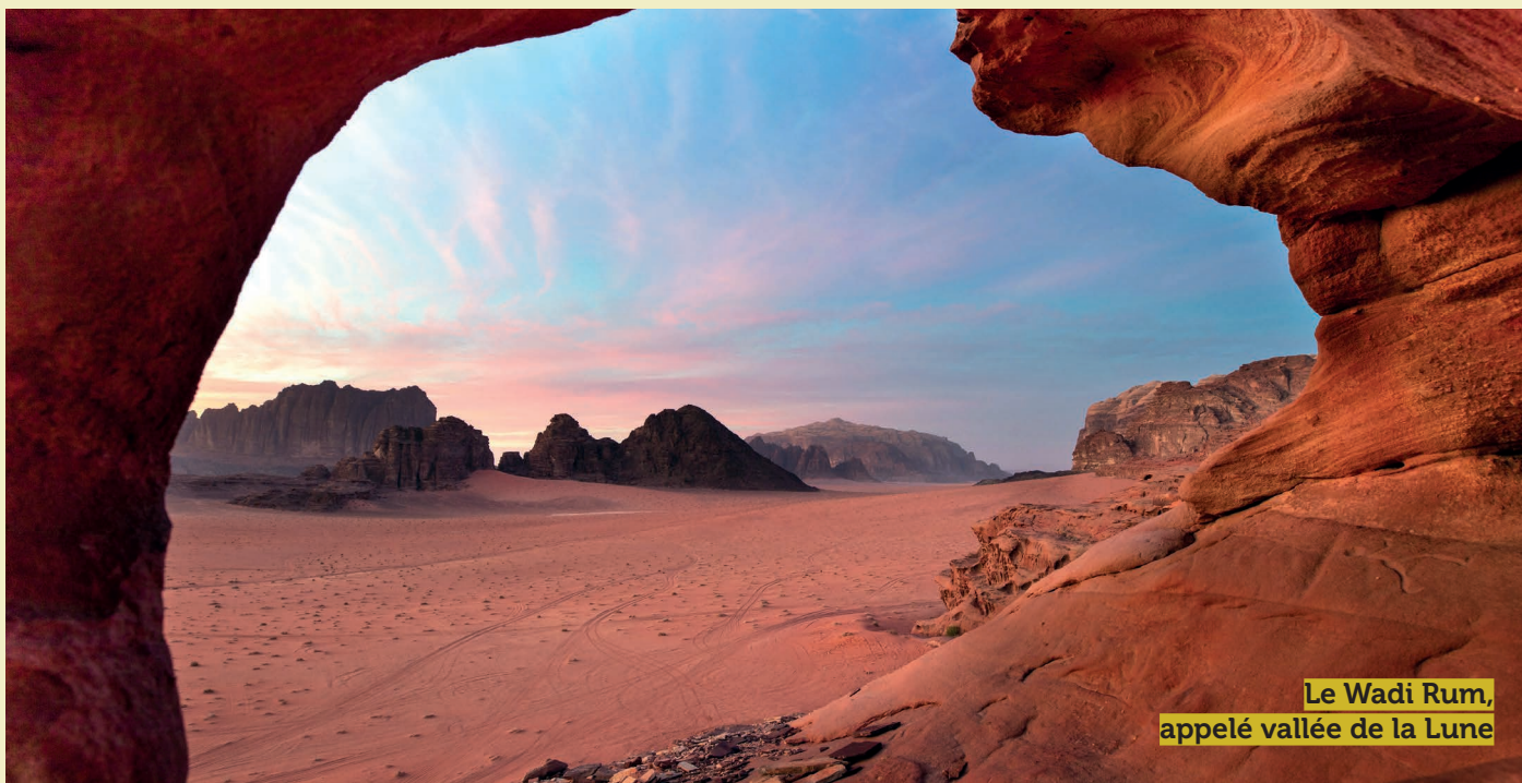
Le Wadi Rum, appelé vallée de la Lune

Déjeuner dans un restaurant sur le site. Dîner et nuit à Pétra.