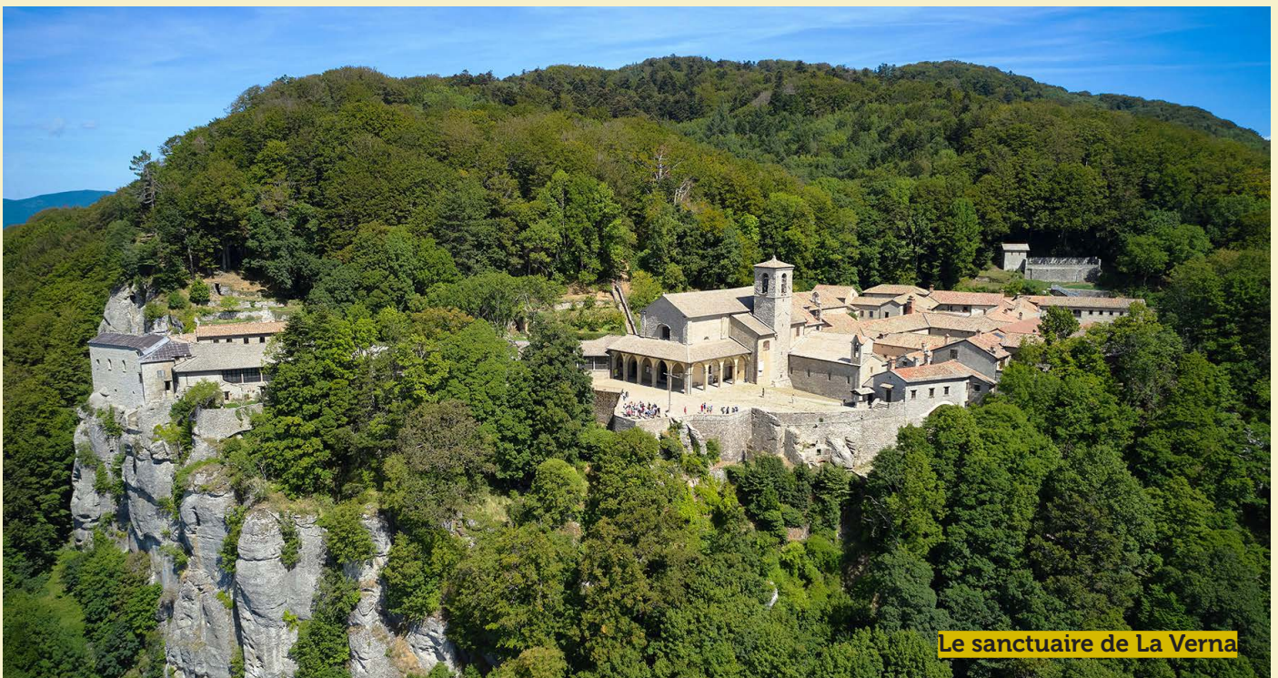
Le sanctuaire de La Verna