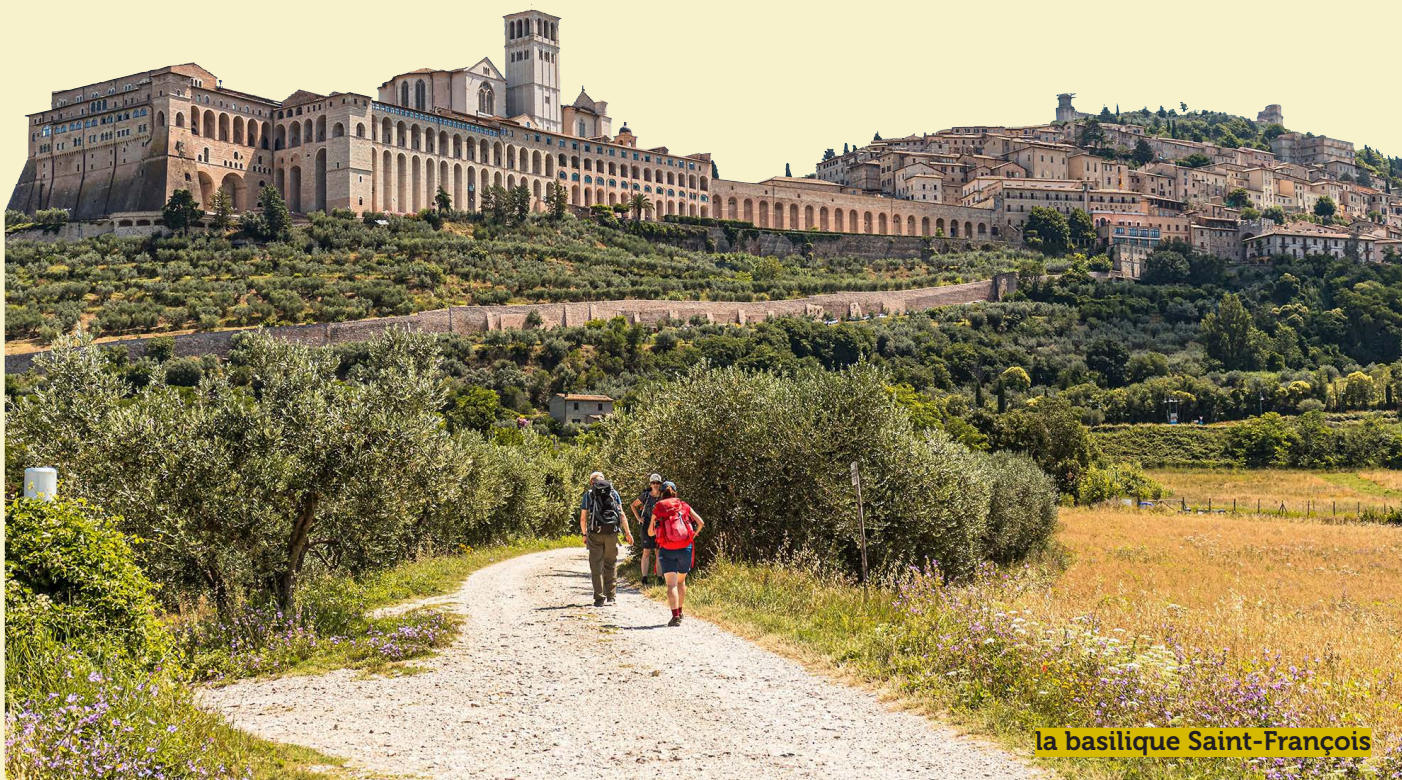
la basilique Saint-François

Découverte du couvent Saint-Damien où saint François composa le cantique du soleil et où vécut la première communauté des Pauvres Dames fondée par sainte Claire.